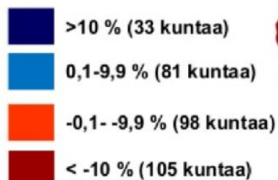
Väestöennuste kunnittain 2015-2030 (muutos %)

Sinisellä väestö kasvaa Punaisella väestö vähenee